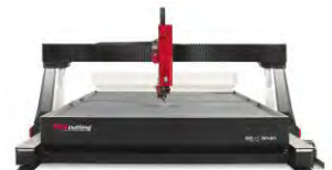
BP-H ® series