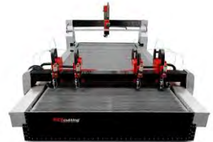
BP-M ® series