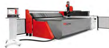
SM-C ® series