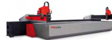
SM-S ® series