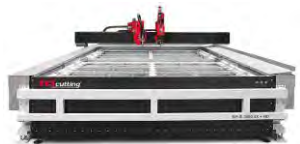
BP-S ® series