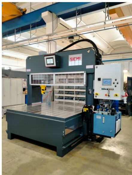
Symbolfotos (mit optionalem Zubehör)