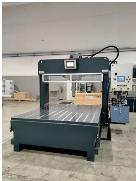
Symbolfotos (mit optionalem Zubehör)