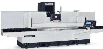
Symbolfoto (zeigt Modell FSG2064ADIV)