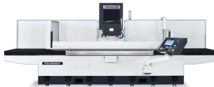
Symbolfoto (zeigt Modell FSG2064ADIV)