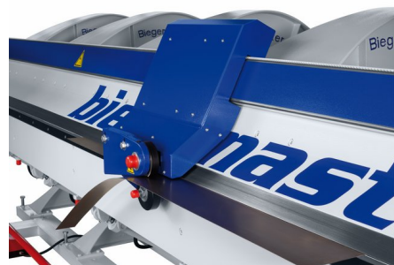
optionaler elektrischer Schneidapparat