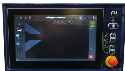
optionale BMS MULTI-Touch