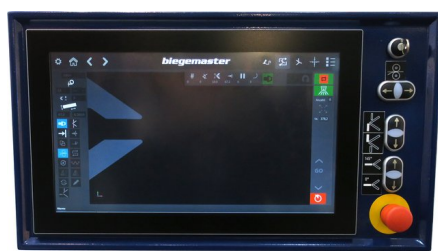
optionale BMS MULTI-Touch